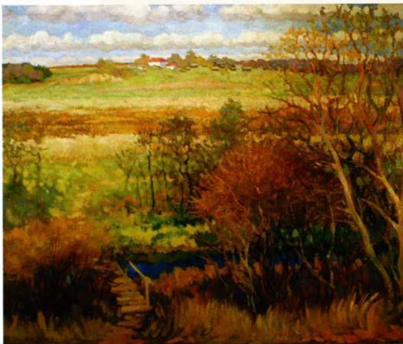
Константин ШЕВАЛЬЕ Деревня Яшино. 1996 Холст, масло 90 x 73

В 2008 году XV Международный фестиваль искусств «Арт-ноябрь» проводится в поддержку Благотворительного Фонда «Семья для каждого ребенка». Завершает выставочную программу юбилейного «Арт-ноября» большая благотворительная выставка живописных и графических работ художников, участвовавших в Фестивале на протяжении минувших пятнадцати лет. Средства от продажи картин будут переданы на осуществление благотворительных программ Фонда «Семья для каждого ребенка».