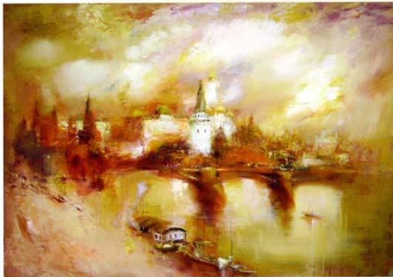
Алла БЕДИНА В начале века. 2007 Холст, масло 80 x 100