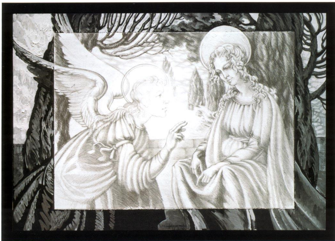
1. М. Сюрина. Благовещение. 2012. Б., картон, карандаш, тушь, акрил. 70x100. Из собрания журнала «Русская галерея – XXI век» M. Syurina. Annunciation Day. 2012. Paper, cardboard, ink, pencil, acrylics. 70x100. «Russian Gallery – XXI Century» Magazine collection